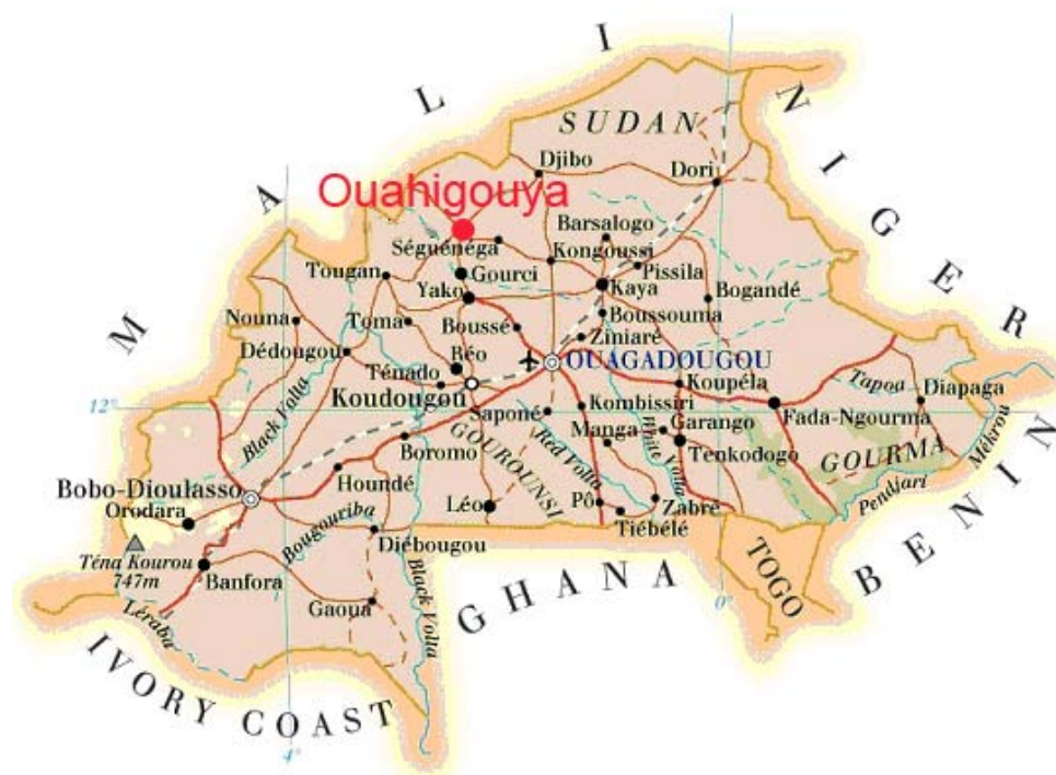
Figure 1 - Carte du Burkina Faso

Dans le cadre de son programme de recherche (Progeboues), le CREPA appuie la commune de Ouahigouya pour le développement d'une stratégie de gestion durable des boues de vidange. La connaissance des quantités de boues à évacuer est indispensable pour organiser le service de collecte, dimensionner les ouvrages de traitement, évaluer le marché et la rentabilité pour les opérateurs, et finalement planifier l'ensemble de la filière des boues de vidange.