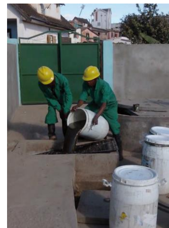
GRET – Juin 2015