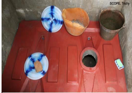
Drop hole in the middle, urine hole with proper slope in the front wash water bowl in the rear